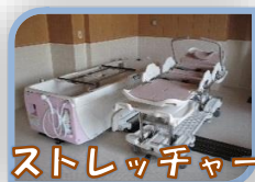
ストレッチャー浴

介護保険制度に基づいて、お客様のニーズに対応したサービスをご提供いたします。 機能訓練・入浴・食事・レクリエーション・健康チェック・送迎など 心も体もリフレッシュ出来る場所。 そんなデイサービスを実感してください。