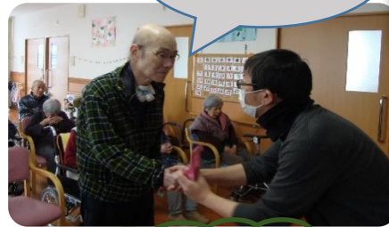
主任 体に気を付けてね