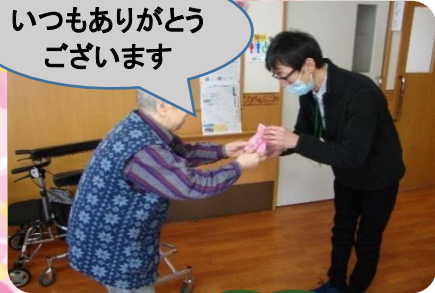
施設長 いつもありがとう