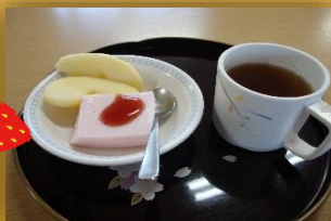
～ある日のおやつ～ いちごのパバロア &リンゴ